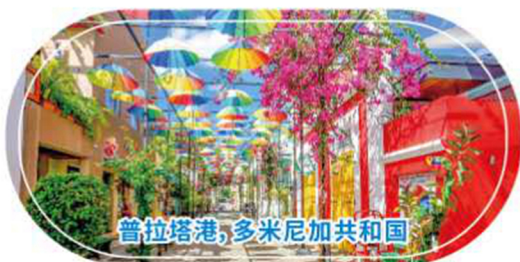
普拉塔港, 多米尼加共和国