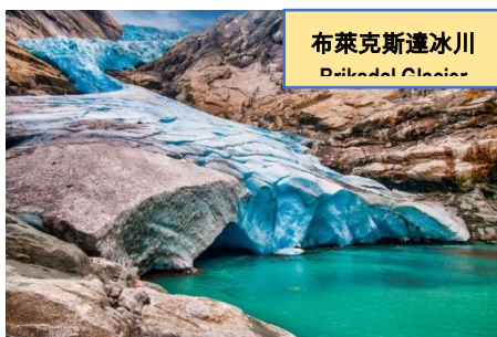
布萊克斯達冰川 Briksdal Glacier