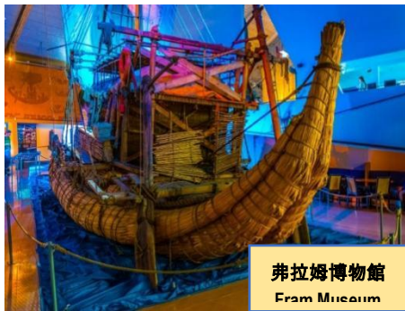
弗拉姆博物館 Fram Museum